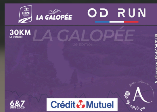
30KM LA GALOPÉE (dimanche)