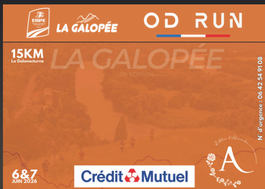
15KM LA GALONOCTURNE (samedi)