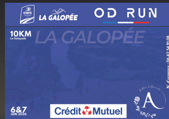
10KM LA GALOPAIDE (dimanche)