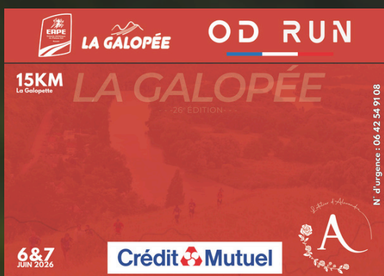
15KM LA GALOPETTE (DUO COMPRIS) (dimanche)