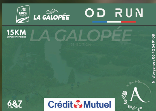
15KM LA GALONORDIQUE (dimanche)